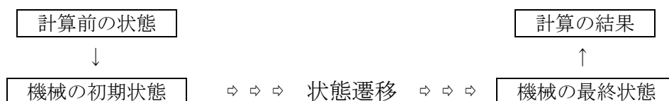
図1 機械・物理現象の状態遷移による計算過程の実現

一方で，計算を行うために色々な機器が利用されています．素朴な計算器（手動による珠算）のソロバンの珠は，数字を表現するために使われています．珠がどの状態にあるかで計算の進行していく過程が表現されています．すなわち，「機器の状態遷移」に「計算過程」をうまく対応させて，そこから意図する計算結果を上手に読み取っています（図1）．